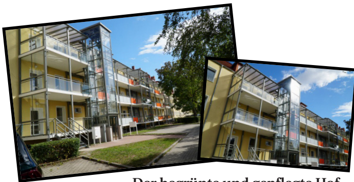
Der begrünte und gepflegte Hof mit dem Fahrstuhl