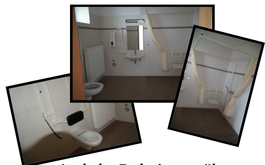
Auch das Badezimmer überzeugt durch seine Barrierefreiheit