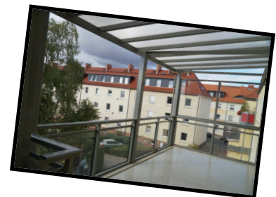
Der großflächige Balkon